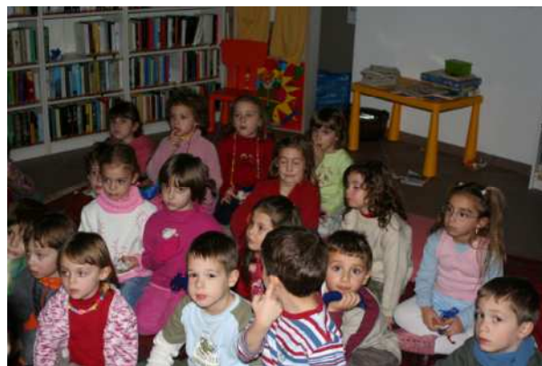
Immagini dalla notte dell'amicizia